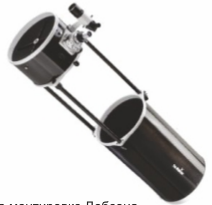
Рис. 1. Сдвижная оптическая труба телескопа на монтировке Добсона

Для установки комплекта на телескоп на монтировке Добсона с цельной или сдвижной трубой или на оптическую трубу телескопа системы Ньютона необходимо заменить крепление, установленное на боковой части оптической трубы, на крепление, входящие в комплект для модернизации.