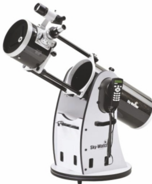
Рис. 4. Телескоп на монтировке Добсона со сдвижной трубой и установленным комплектом модернизации Dob SynScan Upgrade Kit.

Возможно, после этого потребуется произвести юстировку телескопа перед его использованием.